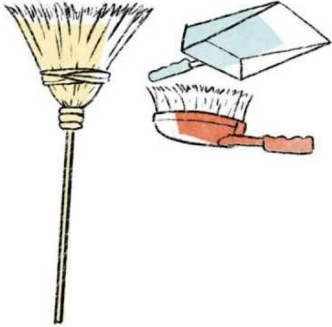
Guizer piny Reingjering

This work is licensed under a Creative Commons Attribution 4.0 International License. https://creativecommons.org/licenses/by-nc-sa/4.0